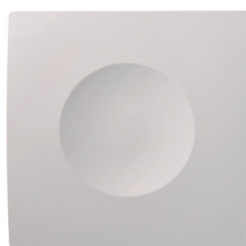
INEA vue de face