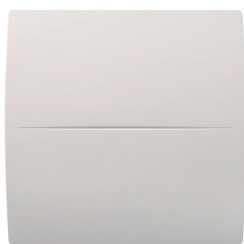
INEA EXPERT vue de face